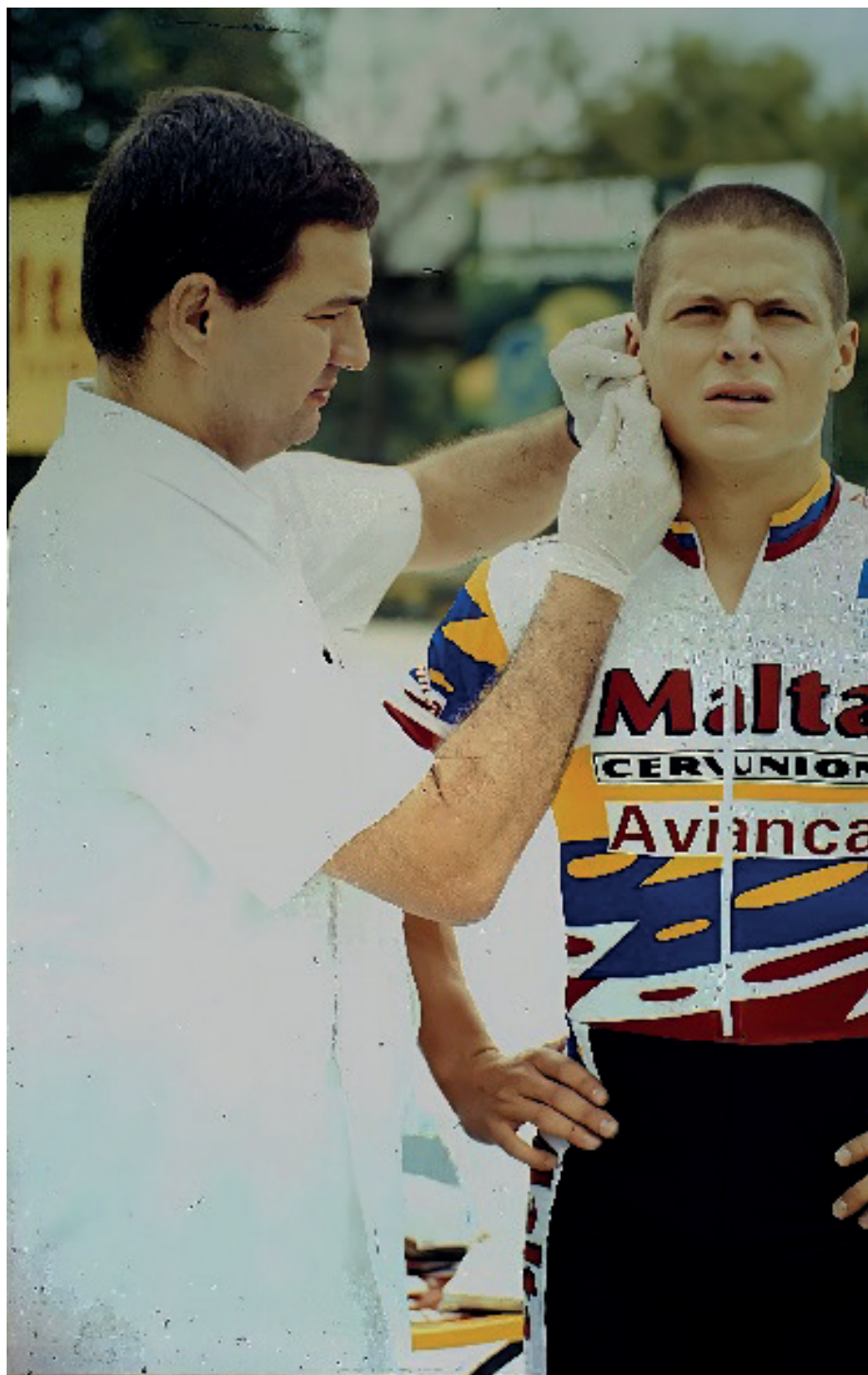
FIGURA 4. Muestras de Lactato seriadas en patinadores de Colombia, 1995.

ambas de Bogotá, y la Universidad de Boyacá en los últimos años. (15-16)