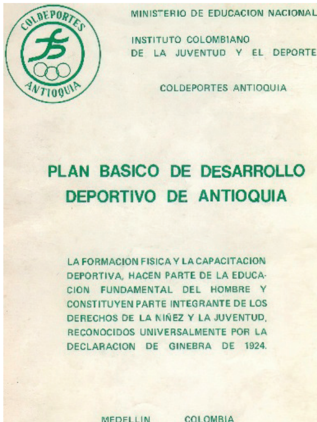
FIGURA 2. Plan Básico de Desarrollo Deportivo de Antioquia, 1975.

en la atención y evaluación de los deportistas, su relación con los Centros de Educación Física departamental, la capacitación a los entrenadores y el personal de la medicina deportiva, la investigación que iniciaría años después y la promoción en las facultades de medicina (Figura 2). (14)