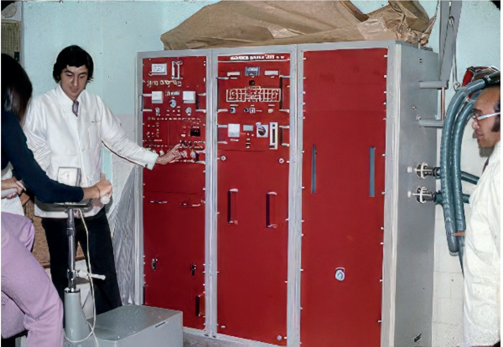
FIGURA 3. Primer ergoespirómetro de Coldeportes Antioquia en su convenio con la Universidad de Antioquia, 1975.

especialidad médica en Colombia y Suramérica, en Medicina de la Actividad Física y el Deporte en la U de A.