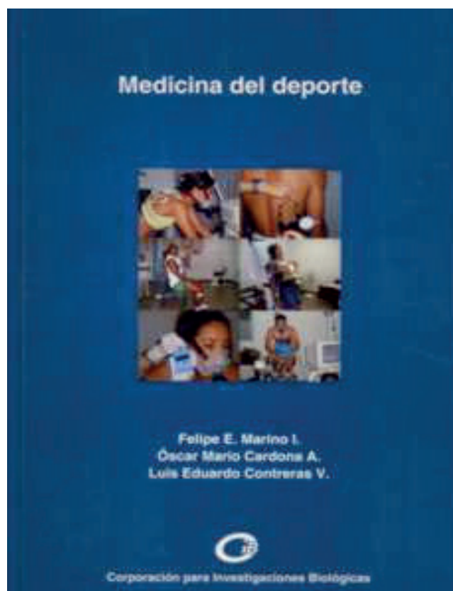
FIGURA 5. Algunos de los libros editados por la División Médica de Indeportes Antioquia como apoyo a la especialidad.