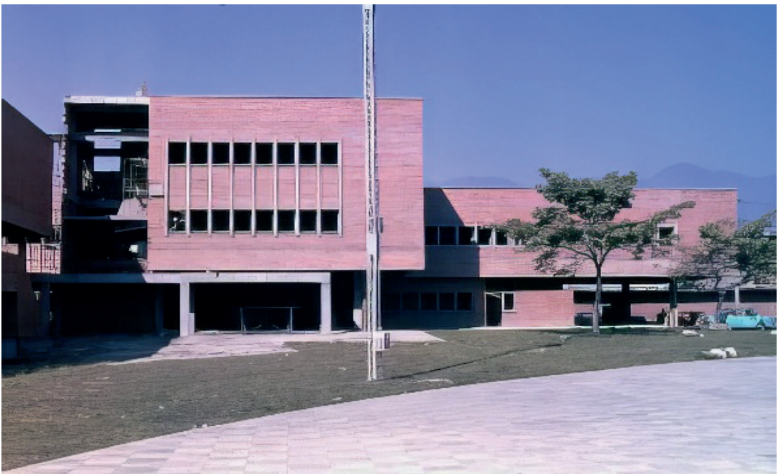
FIGURA 1. Construcción de la Casa del Deporte “Jaques de Bedout Villa”, 1978.

El concepto inicial de la Medicina Deportiva fue muy asistencial y así consta en el primer “Plan Básico de Desarrollo Deportivo de Antioquia” , 1975, el cual manifiesta la importancia de la especialidad